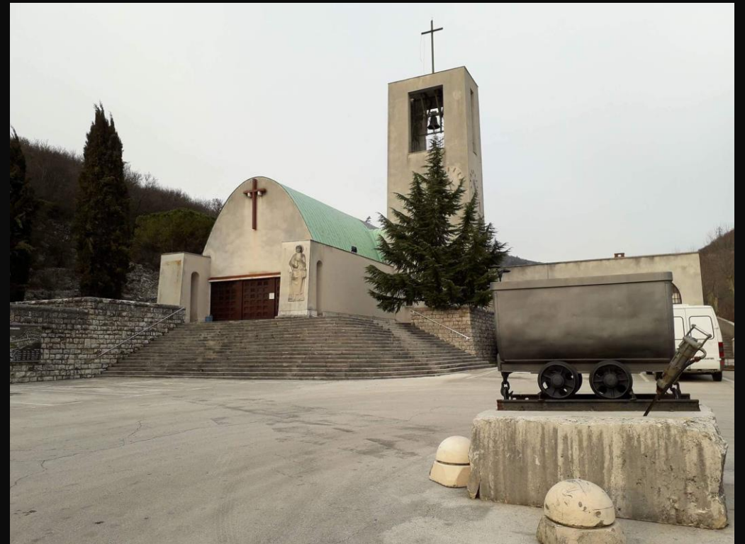
Crkva sv. Barbare u obliku vagona